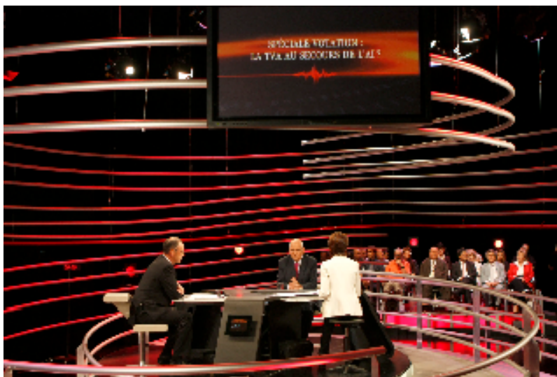
Sait-on reconnaître Guy Parmelin et Pascal Couchepin, dans la seule image de plateau trouvée dans les dossiers photos du service de presse? De dos, Lucky Luke.

Me vint alors une idée malencontreuse: et si les mêmes questions avaient été posées en même temps aux six personnalités invitées dans une même émission, de télévision, que se serait-il passé? Après deux exposés, le troisième invité s'en serait pris aux deux précédents pour faire comprendre que le parti dont il est le haut-parleur fait vraiment mieux que les autres. Et ainsi de suite: on aurait rapidement assisté à quelques belles empoignades du genre presque tous les autres sont mauvais puisque nous sommes les meilleurs! Ainsi font font font souvent les fins de soirées animées par Infrarouge : des idées intéressantes sont noyées rapidement un bain de paroles qui font spectacle!