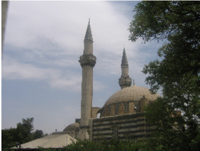
Deux vrais minarets d'une mosquée de Damas: autant que la moitié de ceux érigés en Suisse! Comme si les minarets étaient seuls en cause...

Cela se passe dans un petit pays d'Europe alpestro-centrale. Une bonne vingtaine de jeunes de moins de dix-huit ans s'en sont allés quérir le premier titre de champion du monde attribué à ce pays dans un tournoi d'un jeu nommé balle-au-pied. Les deux-tiers de ces jeunes et brillants joueurs sont des «segundos». Et parmi eux, la moitié environ sont des enfants de parents de pays musulmans.