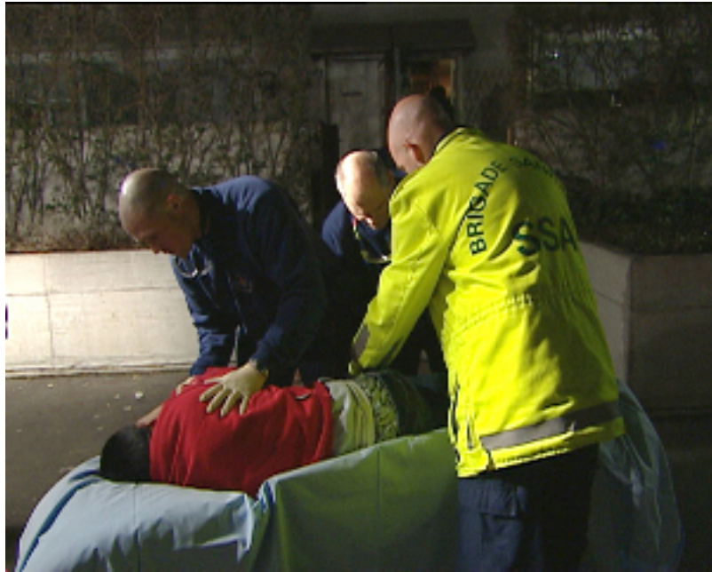
Sur TV 5 le vendredi 22 mai 2009: un "Temps présent": "Permis de se saouler". Et en plus nécessité de se faire soigner...