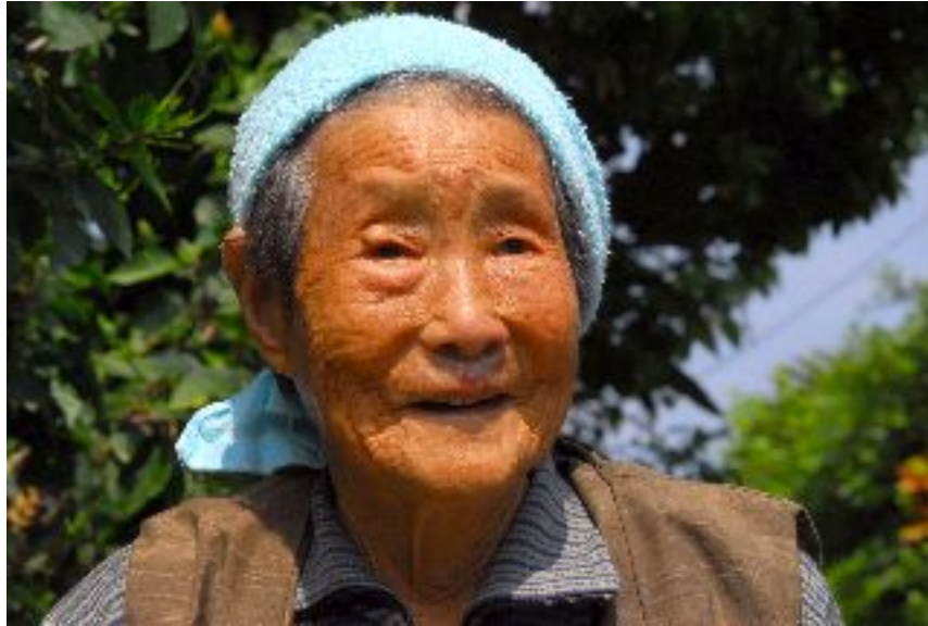
TP 25.12.08 - Comment passer le cap des 100 ans.

Un TP consacré à la drogue qui devait passer début 2009 vient d'être interdit d'antenne, suite à une ligne sniffée par un technicien qui n'a pas été signalée à la hiérarchie par le réalisateur et le journaliste.